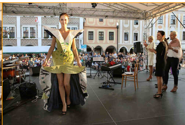
Telč festivalem žije a pro diváky, vedle filmových projekcí, má festival řadu kulturních zpestření