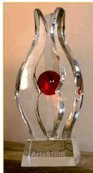
Skleněná umělecká plastika představující GRAND PRIX Vojtěcha Jasného