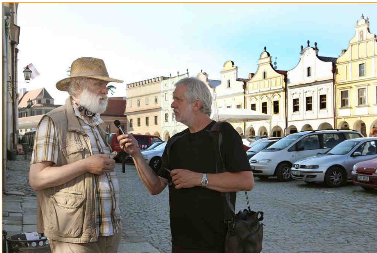
Rozhovor pro ČTK