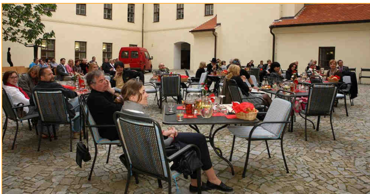
Univerzitní nádvoří, kde probíhalo udílění cen 9. ročníku EFF Arts&film