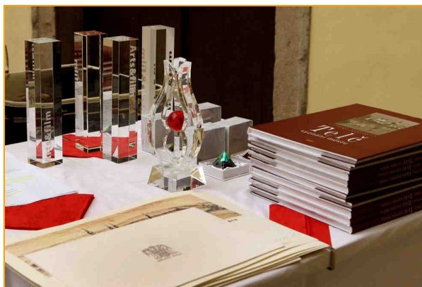
Ceny 9. ročníku EFF Arts&film