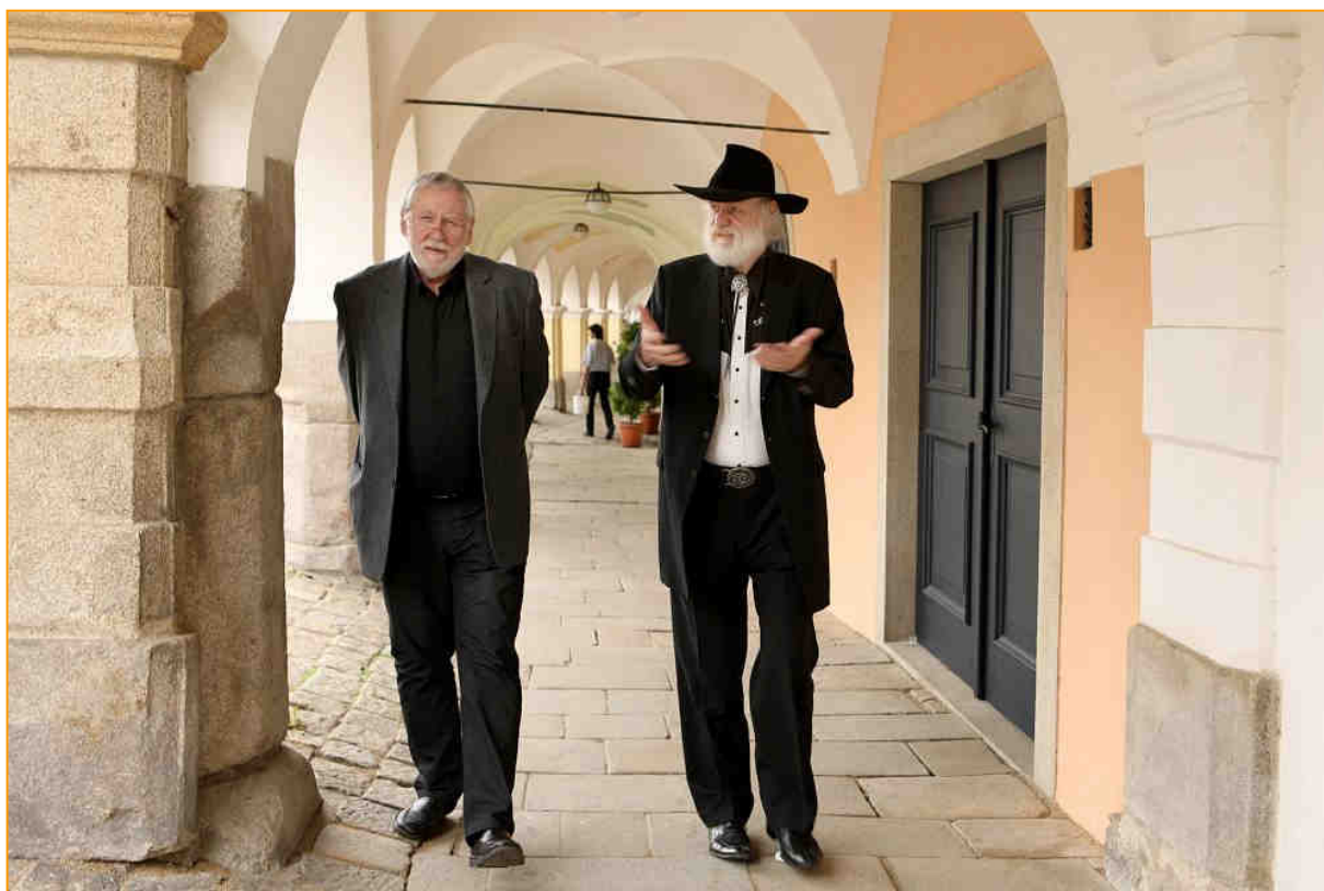
Procházka podloubími v Telči na náměstí Zachariáše z Hradce je vždy inspirující