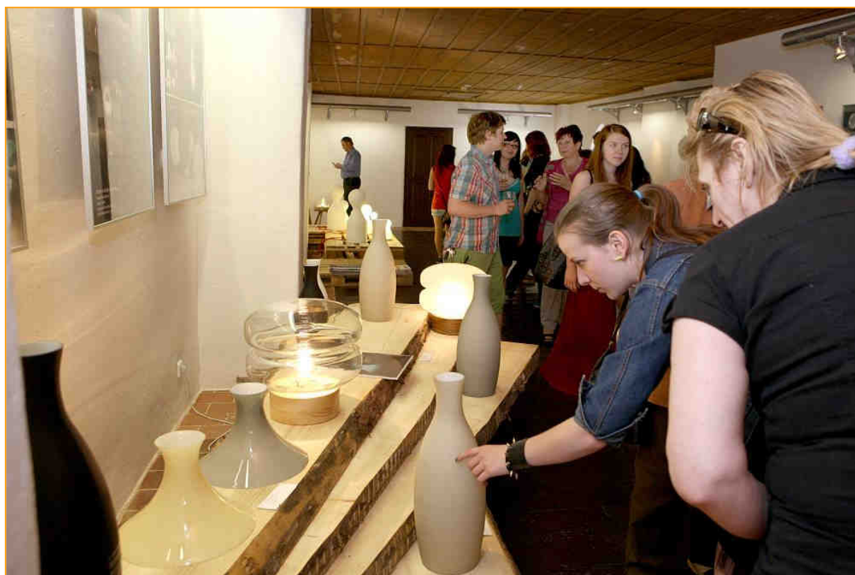
Na festivalu předvedli studenti Umělecko-průmyslové školy v Jihlavě své návrhy svítidel